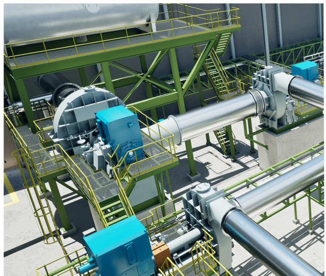
Mechanische Brüdenverdichtung (MBV) ➤